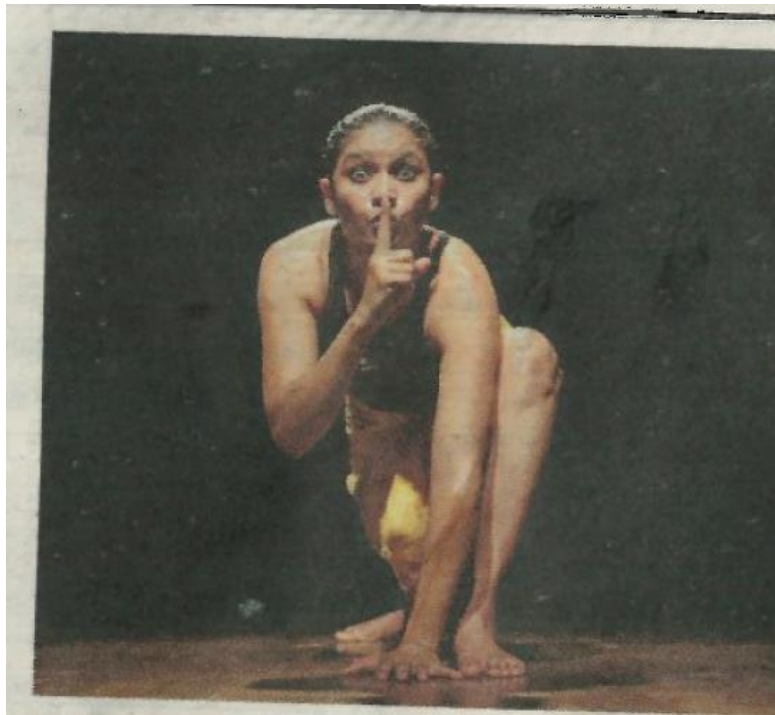
Nidravathwam Musiche danze e colori dell'antica India nello spettacolo ispirato al testo sacro Ramayana . Ancora oggi al No'hma, via Orcagna 2, ore 21, 02.4548085.